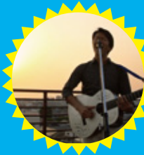
開放感あふれるビル屋上でライブ