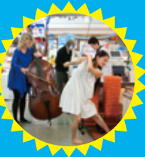
街を歩きながらライブとの出会いを楽しむ