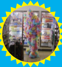
中延商店街にエイリアンが出現!