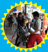
中延にゆかりある竹で楽器&音楽づくりWS