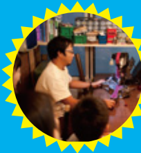
42名のクリエイターが集う施設を公開