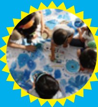
盛りだくさん子ども向けワークショップ